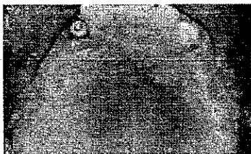
2. Overdenture con protesi parziale per evitare ganci antiestetici.