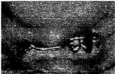
6. Attacchi a barra per aumentare la ritenzione della protesi.