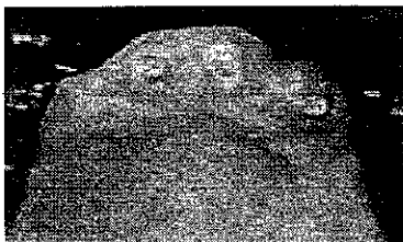
1. Numero variabile di radici per overdenture totale.