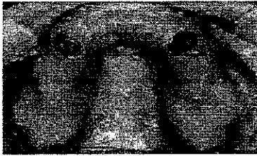
4. Pilastri ideali situati simmetricamente alla linea mediana.